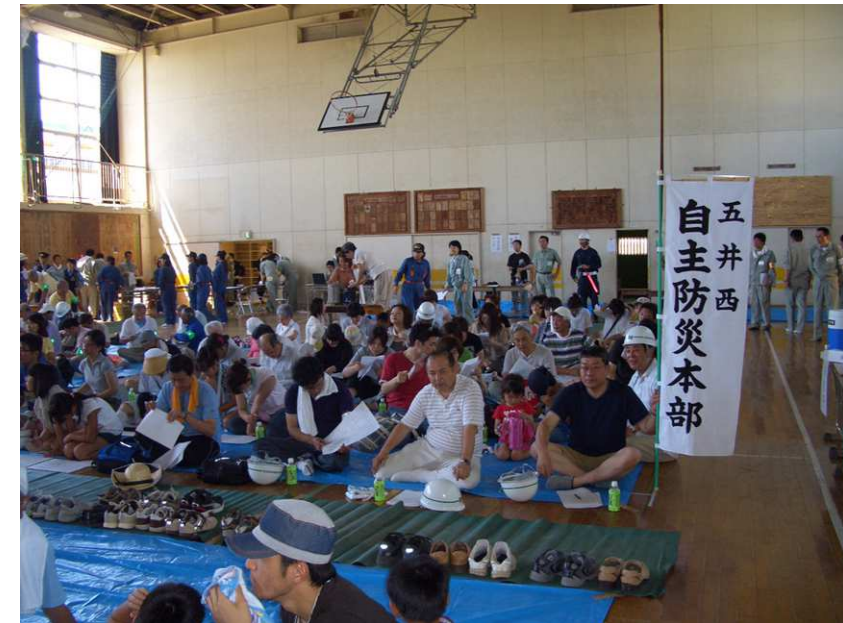
(平成 23 年度水防避難訓練の様子)